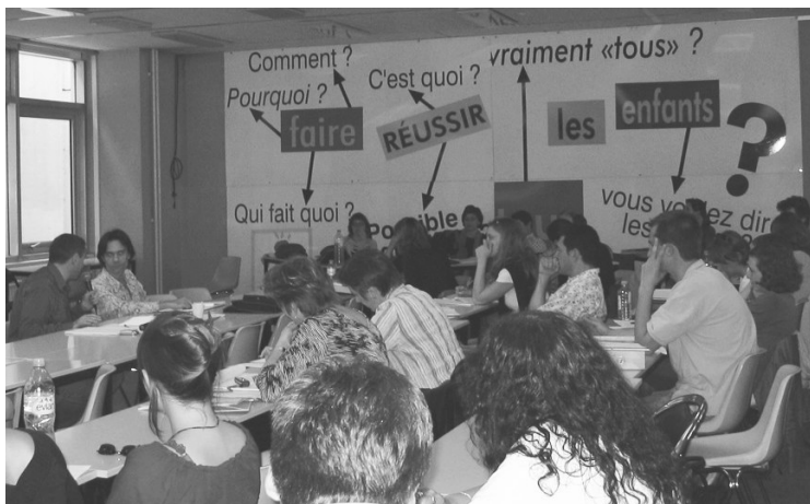
Le SNUipp organise régulièrement des rencontres avec les AVS, dans les départements ou nationalement.

Le SNUipp se prononce pour un plan de professionnalisation des AVS. Ce plan doit permettre d'ouvrir des discussions avec l'ensemble des partenaires pour aboutir.